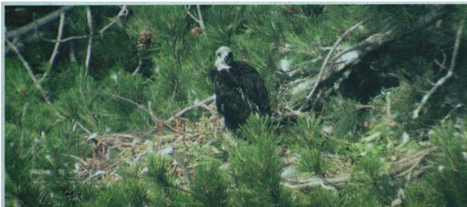
Letošnji orlič planinskega orla v gnezdu na Volovji rebri