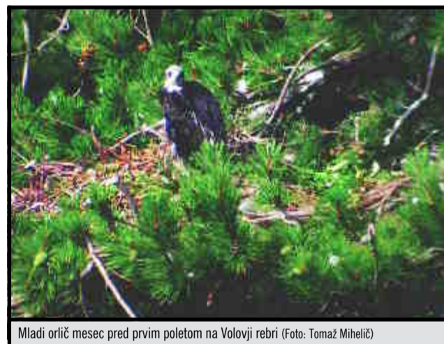
Mladi orlič mesec pred prvim poletom na Volovji rebri