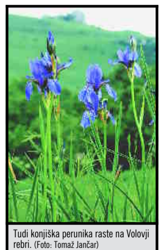
Tudi konjiška perunika raste na Volovji rebri.

planinskih orlih je precej drugačna. Res je sicer, da odrasla orlica, ki tehta od pet do šest kilogramov, lahko zgrabi jagenjčka ali zares mladega gamsa, sicer pa so glavni plen orla zajci in koconoge kure ter, zanimivo, mrhovina. Znanstveniki dolgo niso vedeli, zakaj je orlica precej večja od samca in pogosto kar za tretjino težja. Logika je preprosta: ko vali v gnezdu in v prvih tednih