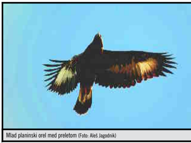
Mlad planinski orel med preletom

Par planinskih orlov ima na Volovji rebri tri gnezda, ki jih upo-