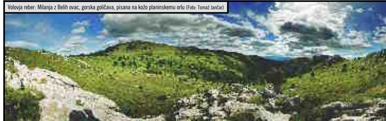
Volovja reber: Milanja z Belih ovac, gorska goličava, pisana na kožo planinskemu orlu